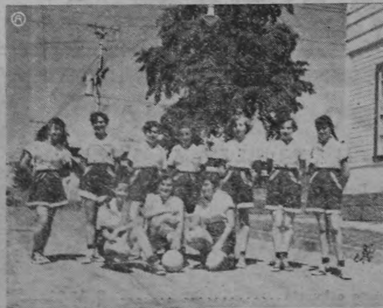
Equipo de Volley Ball del Colegio Anastasio Alfaro, que se clasificó campeón invicto en las competencias realizadas en el Estadio con motivo de la conmemoración del Día de la Raza.