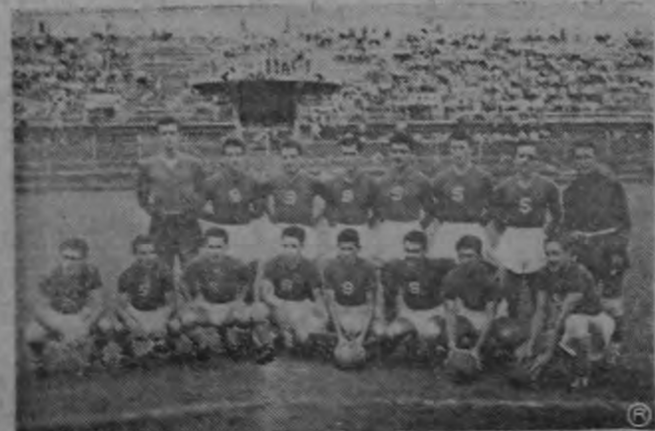
Los Campeones del Saprissa rumbarán mañana para el Estadio de Cartago donde se enfrentarán al Cartaginés en un partido más por el certamen actual