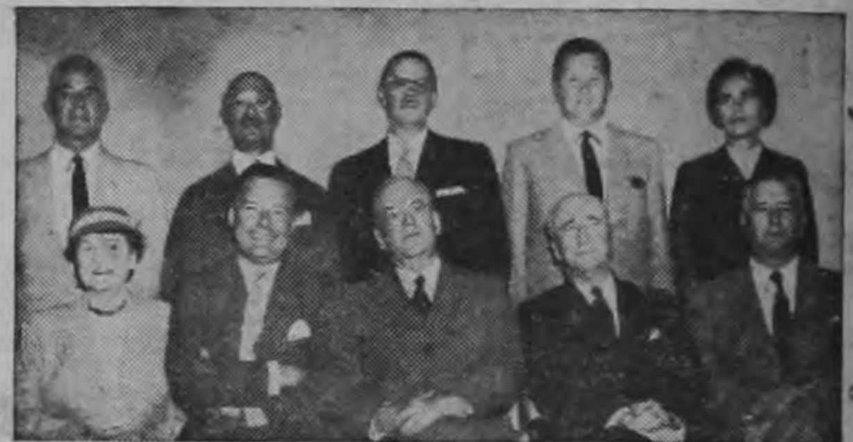
Los miembros de la Delegación de los Estados Unidos a la Octava Asamblea General de las Naciones Unidas, se reúnen en su sede en Nueva York.