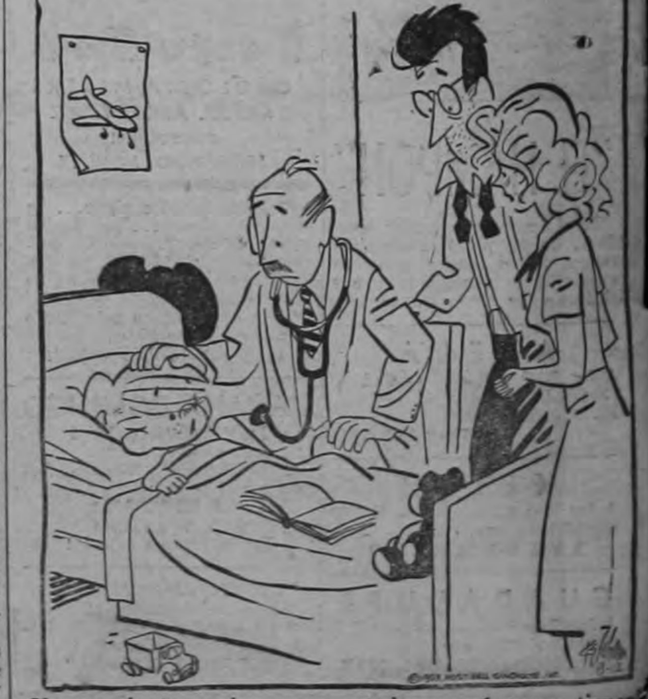
Yo me siento mejor, pero ustedes, ¡qué caras tienen!