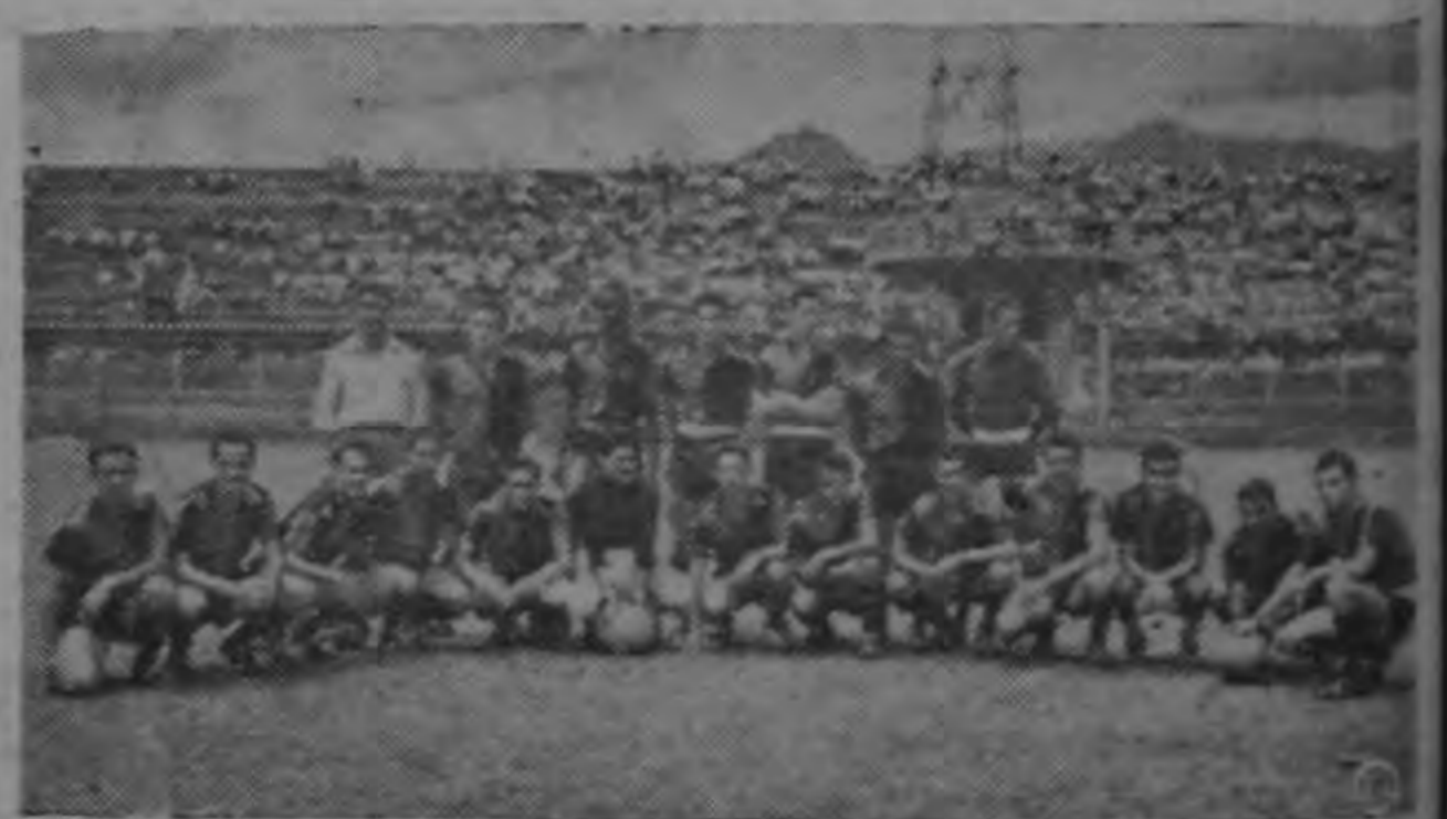
El poderoso equipo de la Liga Deportiva Alajuelense que mañana recibirá la visita del Club Sport La Libertad para protagonizar un difícil encuentro por el Campeonato Nacional de Fútbol.