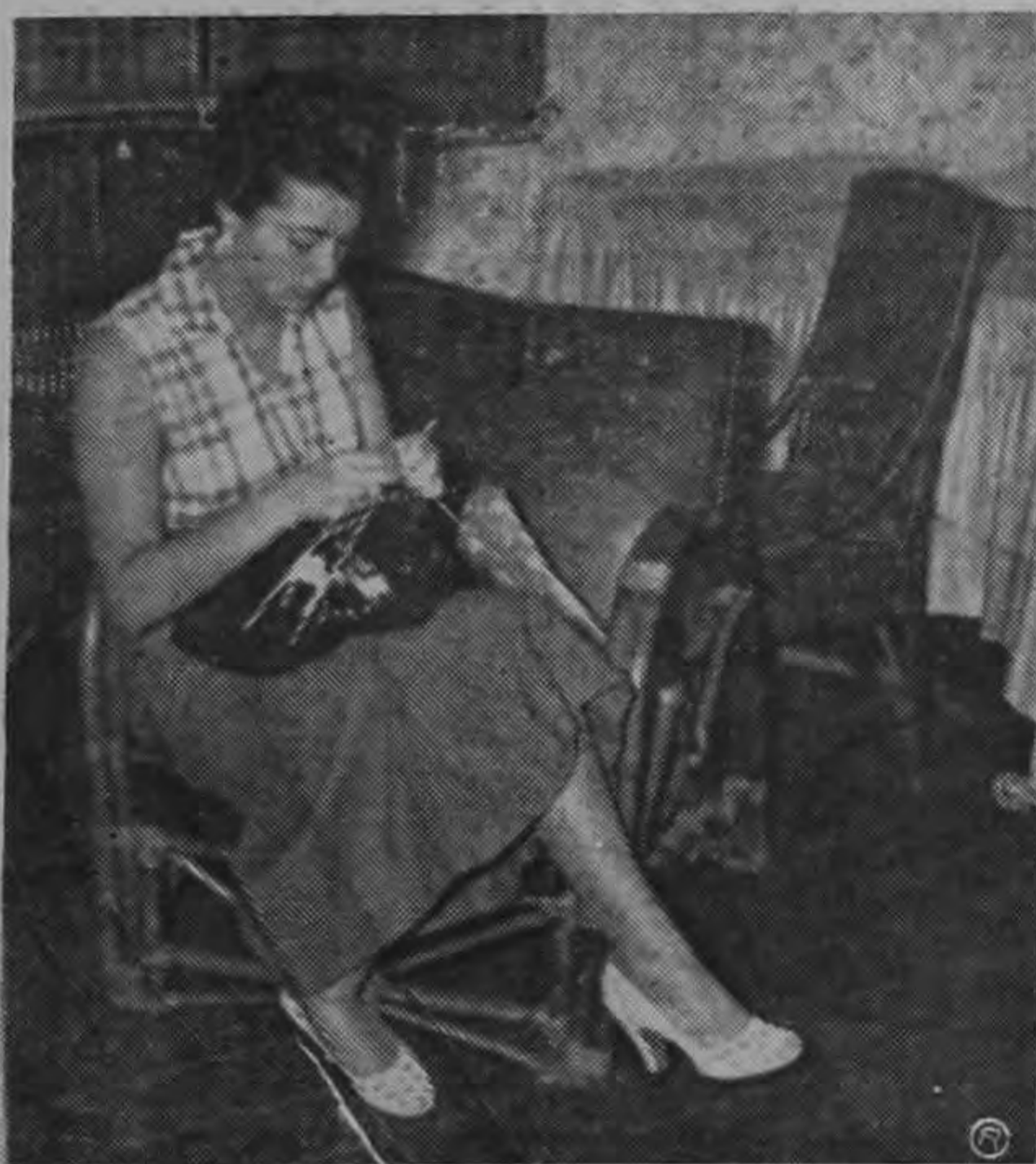
En el gabinetito ojival de trabajo, se entrega a la labor de mano, sin preocuparse por el mando exterior.—(Foto Arévalo).

dear la simpatía de los demás y escuchándola se siente la caricia de una voz joven que atrae con el encanto de una conversación mantenida sin dificultad y sin alardes intelectuales.