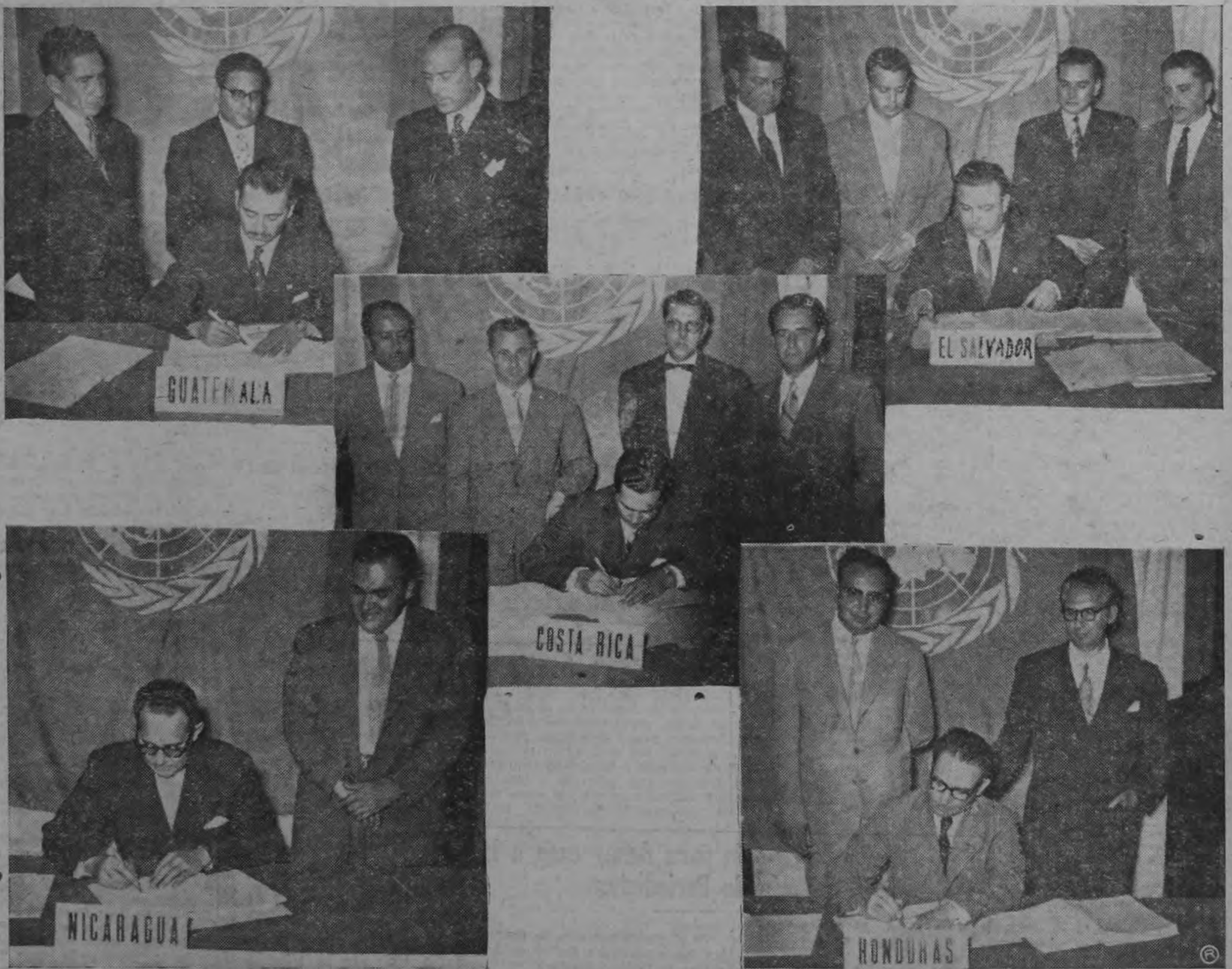
ACTA FINAL.— La cámara de Arévalo captó el momento en que los Ministros de Economía del Istmo Centroamericano estampaban su firma en el acta final en la que se especifican los importantes acuerdos tomados en las reuniones que han celebrado en esta capital bajo los auspicios de la C.E.P.A.L.