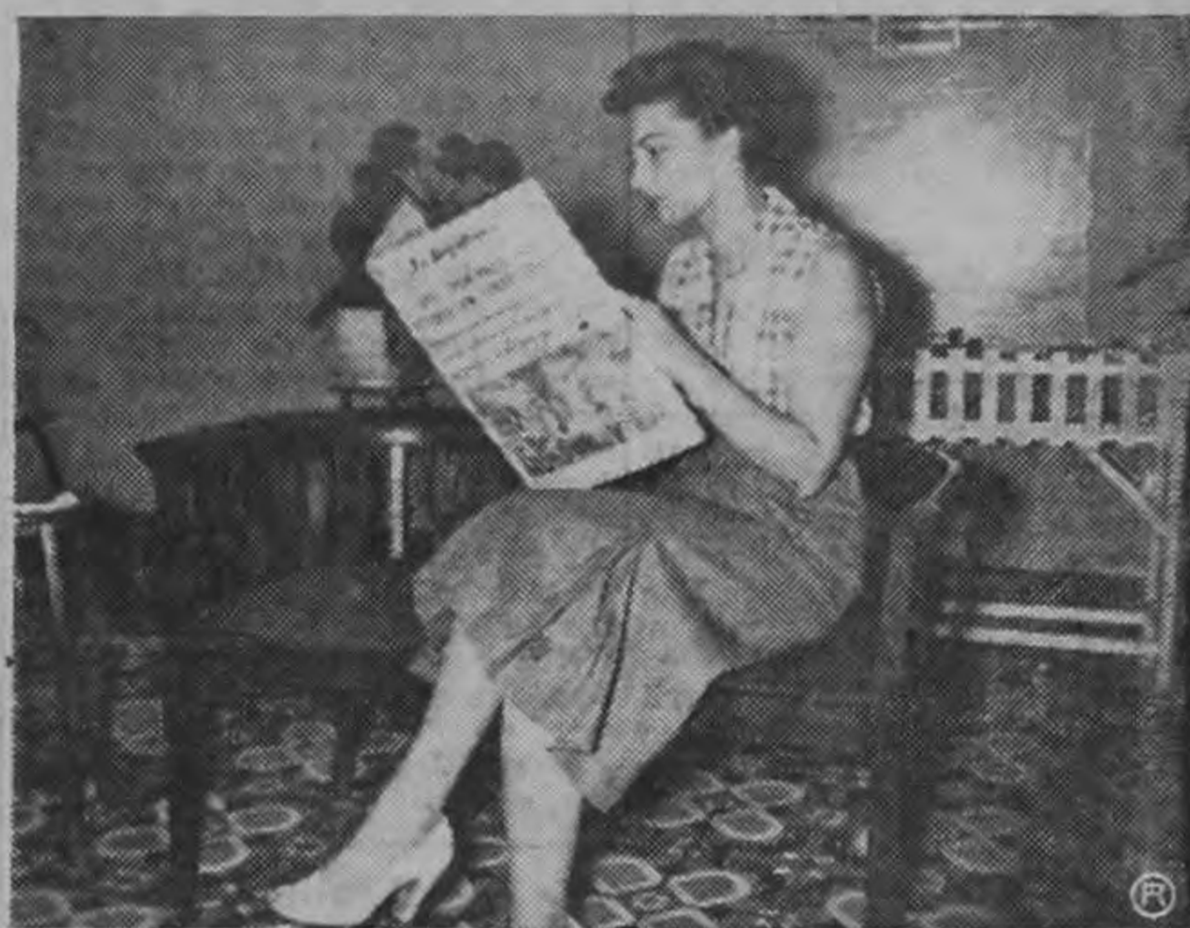
La información de los periódicos es tarea grata que cumple invariablemente.

Recogida por naturaleza y por educación sabe, no obstante, gran-