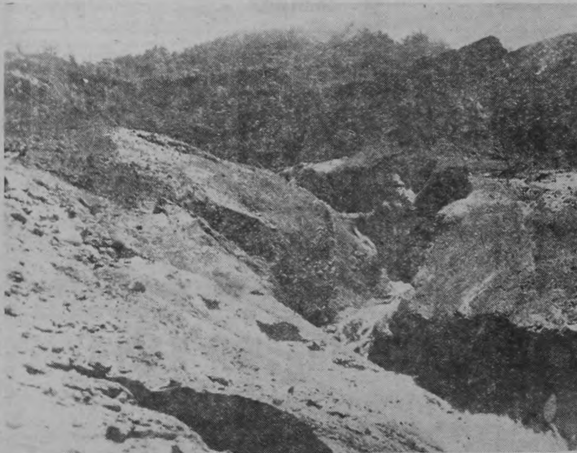
Esta hermosa fotografía, impresionante documento sobre la acción destructora de la erosión, fue distinguida con el Segundo Premio en el concurso artístico promovido por el Ministerio de Agricultura. Nuestro compañero de labores, Rodolfo Carrillo, agrega así un nuevo triunfo a su larga trayectoria de fotógrafo de calidades indiscutibles.