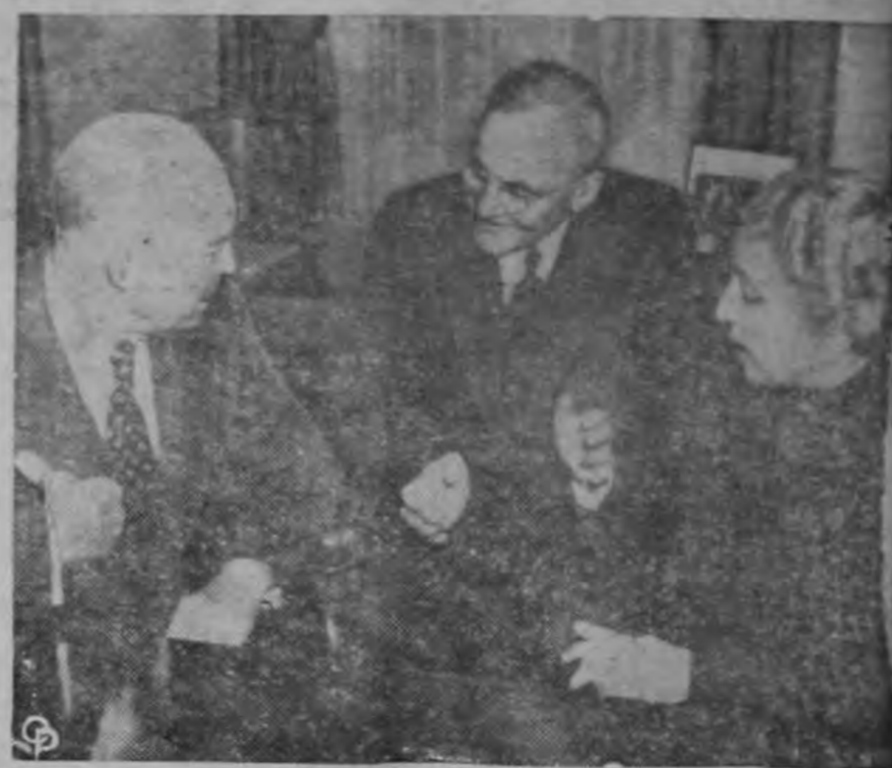
MME. PANDIT VISITA A EISENHOWER.—El Presidente Dwight D. Eisenhower conversa en la Casa Blanca de Washington, con Mme. Vajaya Lakshmi Pandit, Presidenta de la Asamblea General de las Naciones Unidas. A centro se ve a John Foster Dulles, Secretario de Estado. Mme. Pandit dijo que había tenido una discusión "muy franca y cordial" que había incluido la situación en la Corea.