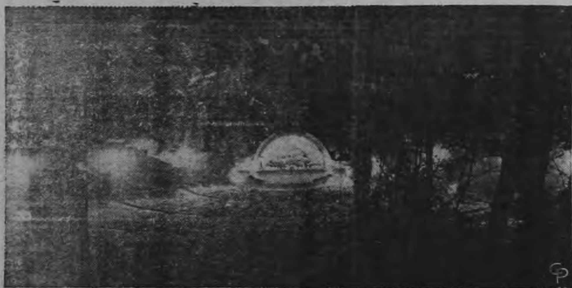
El Tazón de Hollywood —una joya musical que luce esplendorosa bajo las estrellas de California.

En el maravilloso teatro al aire libre se escuchará el milésimo concierto Por BOB J. DURAND