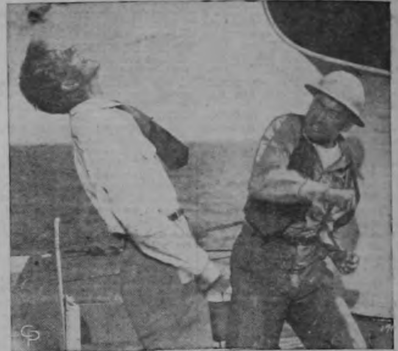
¿Pero, Jimmy, ¿qué es esto?—El Sr. Stewart que fuera un personaje calmado demuestra que se ha convertido ahora en el tipo rudo y ágil para propinar un golpe a la quijada de Dan Duryea.